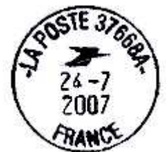
Cachet manuel (timbre à date)