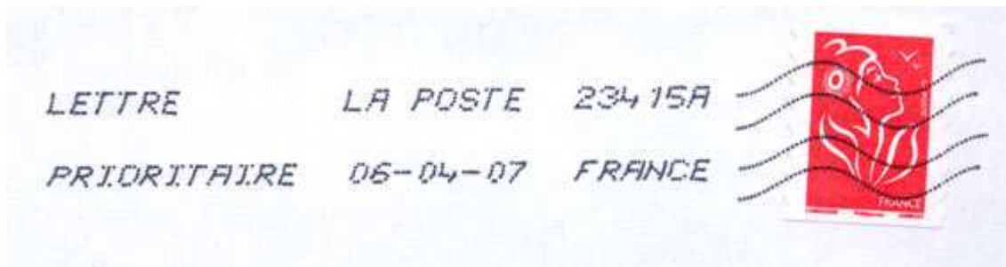
Machine TOSHIBA TSC 100 (jets d'encre)